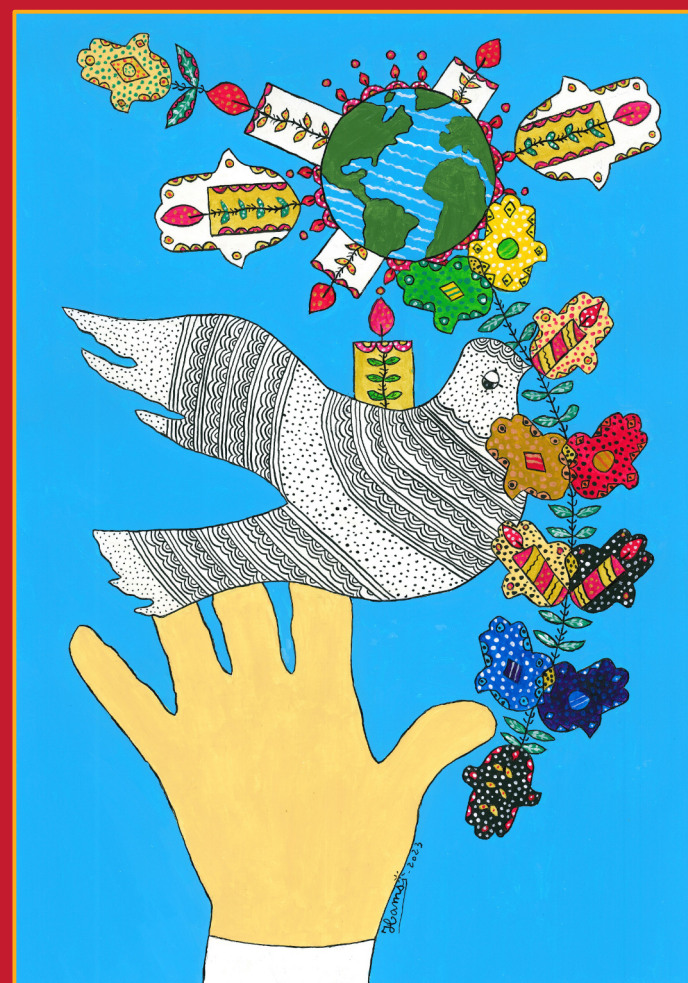
La Paix fraternelle

(30 x 40 cm) signée par l'artiste HAMSI Boubeker et numérotée de 01 à 100